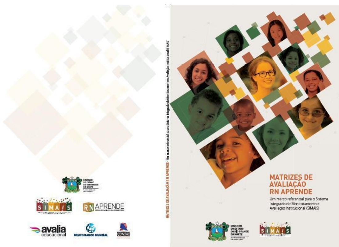
Imagem da capa do documento das Matrizes de Referência das Avaliações do SIMAIS

Após o processo de produção editorial, o documento contendo as Matrizes da Avaliação do SIMAIS foi apresentado à SEEC-RN, em formato impresso, com tiragem de 200 (duzentos) exemplares e em formato digital, conforme arquivo anexo, consolidando, desse modo a entrega do Produto 06 do contrato celebrado entre a Seplan e a Avalia educacional.