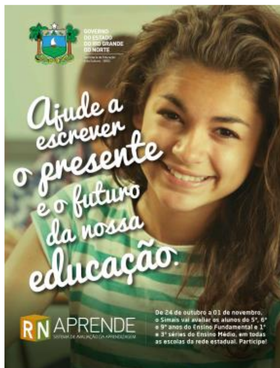
Cartaz Eletrônico Modelo 2