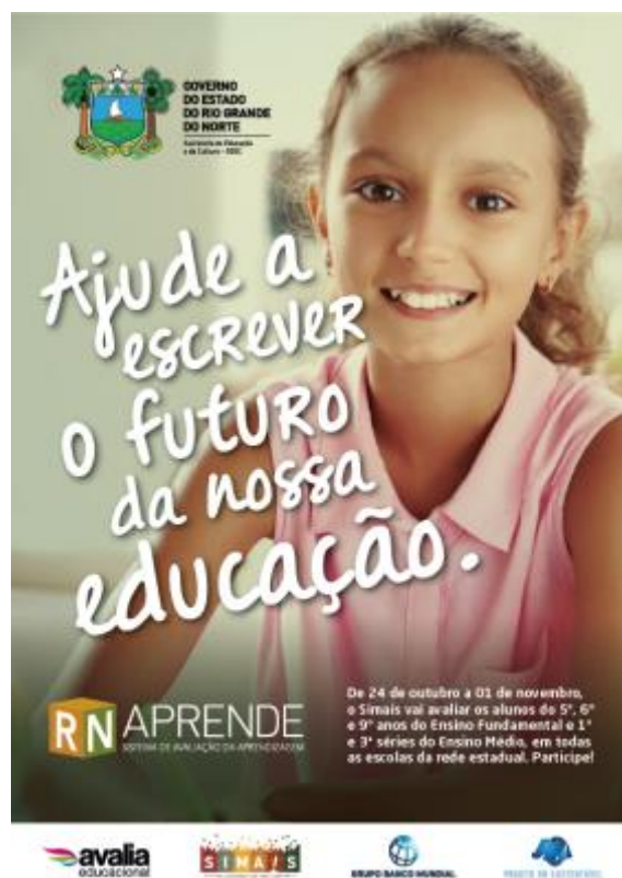
Cartaz Eletrônico Modelo 3