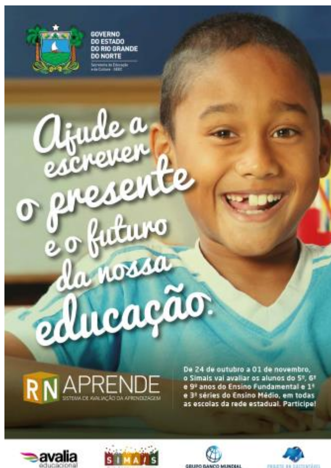
Cartaz Eletrônico Modelo 1

Ainda na perspectiva de dar ampla divulgação ao SIMAIS, particularmente no âmbito da rede de ensino, foram também produzidos 3 (três) modelos de cartazes no formato eletrônico e distribuídos via e-mail para todas as unidades da rede estadual de ensino, Diretorias Regionais de Educação e Cultura (DIRECs), Diretorias Regionais de Alimentação Escolar (DRAEs), órgãos internos da SEEC e outras unidades da estrutura organizacional da educação estadual, os quais foram remetidos aos endereços eletrônicos constantes na base do Sigeduc ou informados pela SEEC, conforme apresentados a seguir.