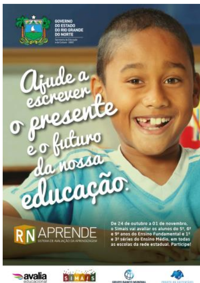
Cartaz Modelo 1

Foram produzidos e distribuídos 3 (três) modelos de cartazes no formato impresso, num total de 1.500 (um mil e quinhentas) unidades, destinados a todas as unidades da rede estadual de ensino, incluindo escolas, centros, Diretorias Regionais de Educação e Cultura (DIRECs), Diretorias Regionais de Alimentação Escolar (DRAEs), órgãos internos da SEEC e outras unidades da estrutura organizacional da educação estadual, conforme apresentados a seguir.