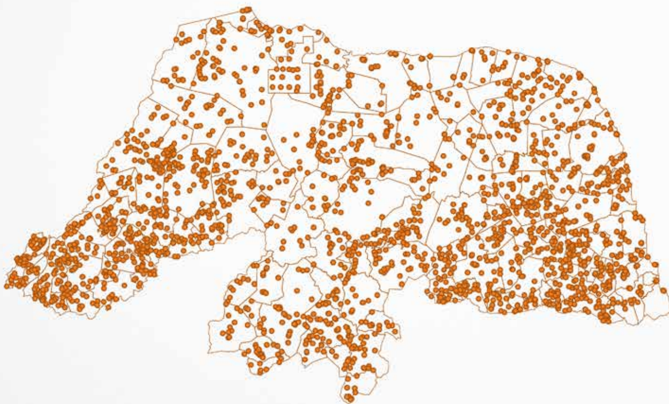
MAPA DE DENSIDADE DAS ORGANIZAÇÕES SOCIAIS POR MUNICÍPIO:

Foram mapeadas 2.513 organizações dentre as 3.685 entidades previamente identificadas. Dada à complexidade e detalhamento de informações contidas no mapeamento, acredita-se que o Estudo se constituirá instrumento fundamental para o planejamento de subprojetos e ações estratégicas futuras a serem desenvolvidas pelo Projeto RN Sustentável, assim como um excelente instrumento de planejamento de políticas públicas voltadas para o desenvolvimento rural sustentável e agricultura familiar no Rio Grande do Norte.