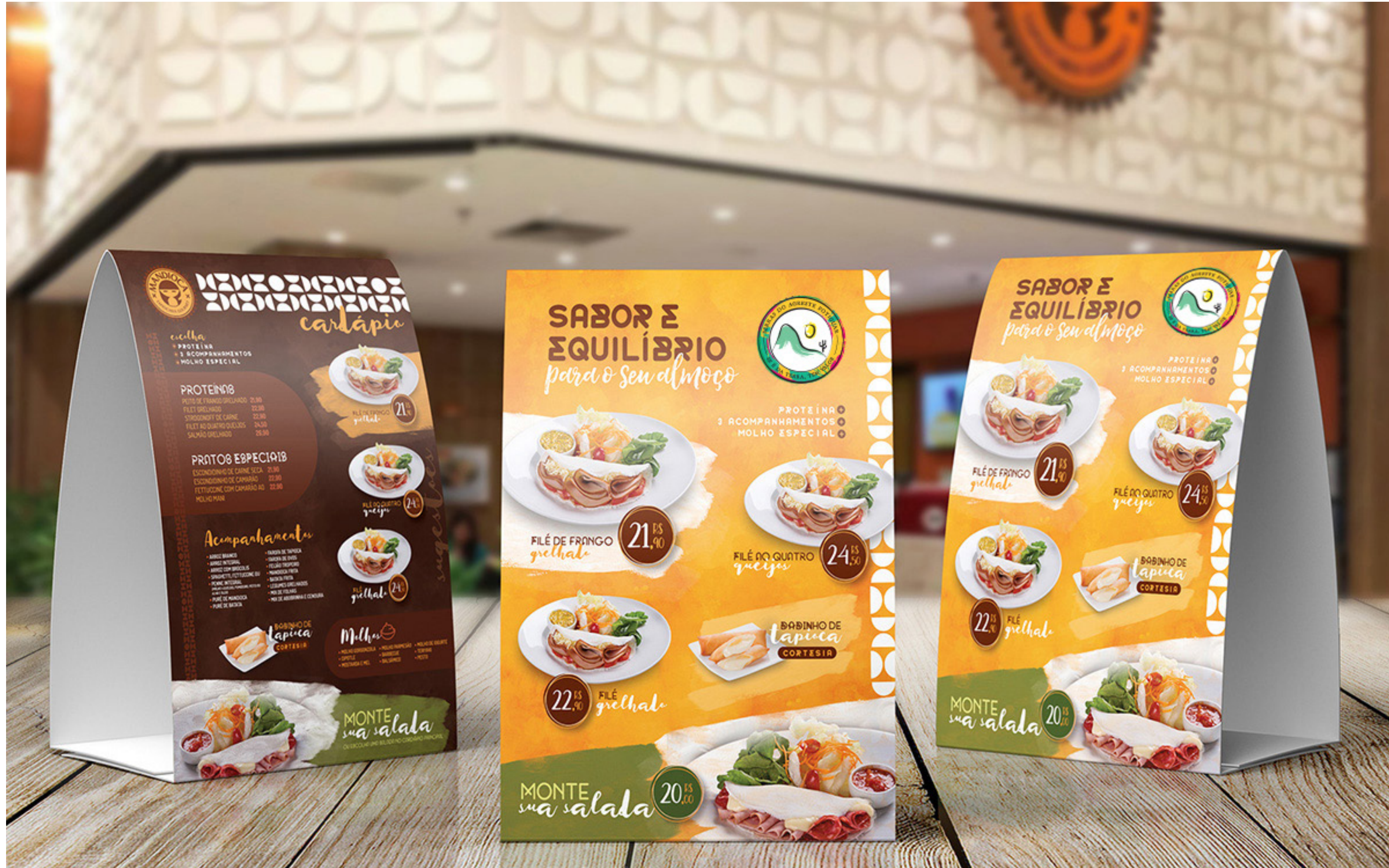
Totem de mesa